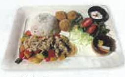
※季節限定ランチのイメージ