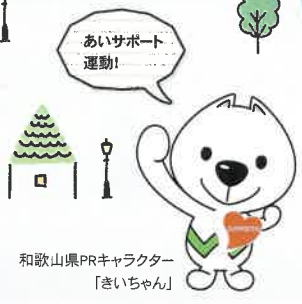
和歌山県PRキャラクター「きいちゃん」